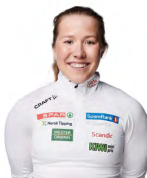
Helene Marie Fossesholm