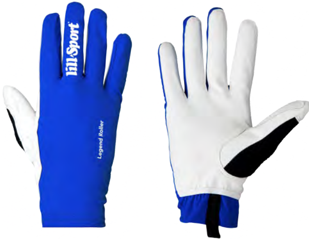
Royal Blue 0408-04