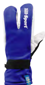
Royal Blue 0617-04