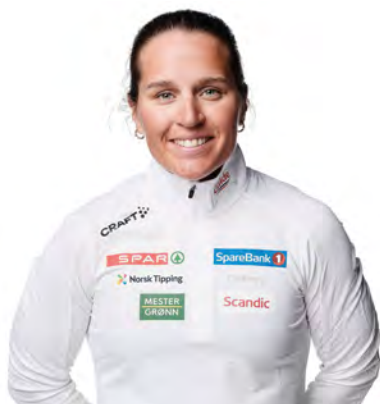
Lotta Udnes Weng