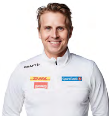
Simen Hegstad Krüger