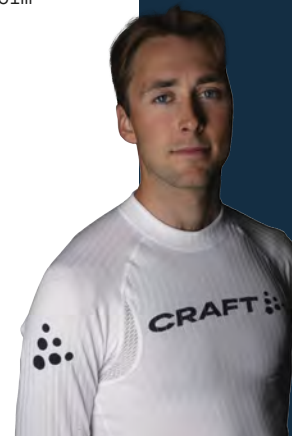
Jarl Magnus Riiber